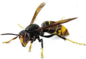
Le frelon asiatique est reconnaissable e.a. avec ses pattes jaunes et noires.

L'éradication du frelon asiatique étant désormais impossible, la Ville de Nivelles et le Cercle Royal Apicole Nivellois (CRAN) œuvrent pour limiter sa prolifération.